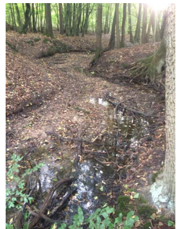
Der Lauf der Bäke bei Schmachtenhagen – links: 2010, rechts: 2016*